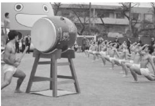
日本体育大学125年の伝統演技「エッサッサ」を披露いただきました