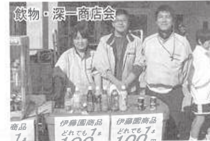
伊藤園商品 どれも1* 100