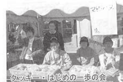
クッキー・はじめの一步の会