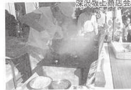
飲物・深一商店会