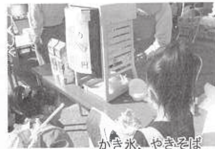
かき氷、やきそば 深沢坂上商店会