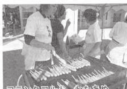
フラシクパレット、わたあめ、 ポップコーン・HFSCC