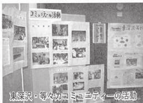
東深沢・等々力コミュニティーの活動