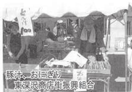
豚汁、おにぎり 東深沢商店街振興組合