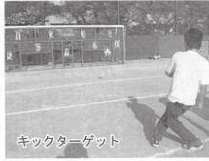
キックターゲット