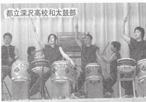
都立深沢高校和太鼓部