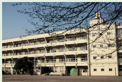
※2 改築前の東深沢中学校校舎