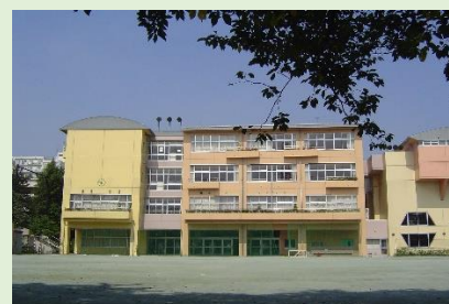
※3 全面改築後の校舎

2001年(平成13年)9月30日 ●東深沢・等々力コミュニティー役員会にて総合型地域スポーツクラブの設立にコミュニティーが受け皿になることが承認された